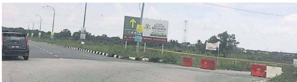
有网民指夏苑往孟加兰巴刹的路口也是被封。

尽管今早相关道路已解封，不过有居民依旧担忧而不敢外出，他们希望警方或相关单位能让大众了解封路的原因，好安民心。