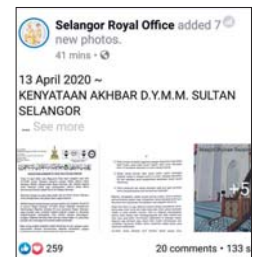
Kenyataan menerusi status di Facebook Selangor Royal Office.

“Solat Jumaat hendaklah digantikan dengan solat Zuhur dan solat fardu serta solat sunat tarawih tahun ini dilakukan di rumah masing-masing,” katanya.