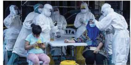
PETUGAS KKM membuat pemeriksaan saringan untuk mencegah penularan jangkitan Covid-19.

Katanya, penduduk masih dibenarkan untuk membeli barangan keperluan harian namun pergerakan keluar masuk perlu direkodkan polis untuk