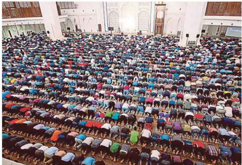
SEMUA masjid, surau dan musolla di Selangor tunda solat berjemaah sehingga 31 Mei depan.

Sultan Selangor titah penangguhan solat Jumaat di Selangor disambung hingga 31 Mei