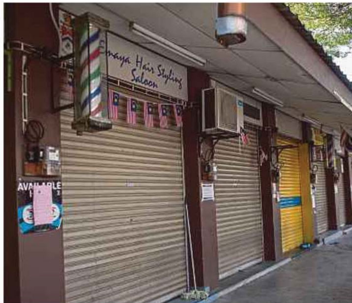
Deretan kedai gunting rambut di sekitar Pantai Dalam tidak beroperasi sepanjang tempoh PKP.

Terdahulu, Menteri Kanan (Keselamatan), Datuk Seri Is-