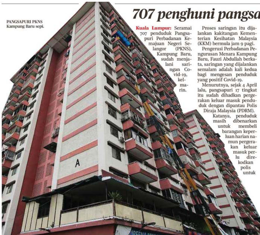
PANGSAPURI PKNS Kampung Baru Sepi.