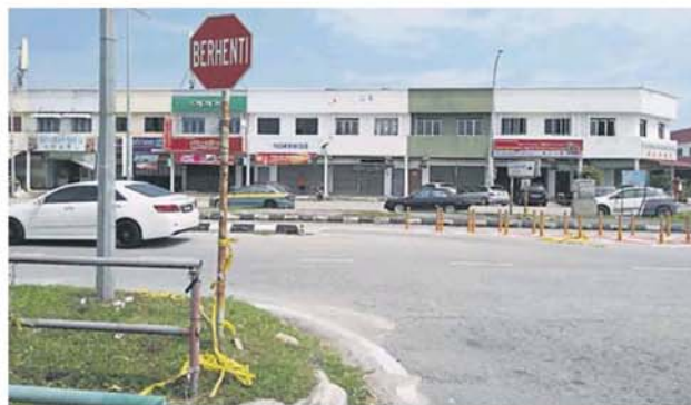
夏苑通往 SPPK 花园的大路，车辆在早上照样通行。

至于从夏苑穿小路到 SPPK 花园的路段仍旧被封，不知情的民众驶至后又纷纷 U 转，另外找路行走。