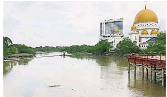
行动管制令期间, 巴生河变清澈了!

垃圾的浮台, 是由雪州大臣机构子公司Landasan Lumayan私人有限公司和非政府组织携手合作, 斥巨资从荷兰引进的处理河流垃圾技术。