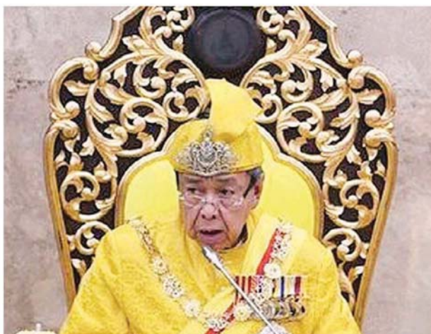
雪州苏丹谕令祈祷等宗教活动展至5月31日。