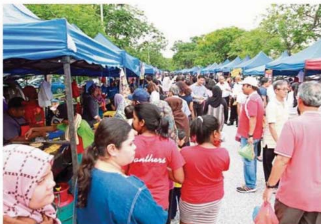
The public will miss going to a bazaar like this one in USJ 4 as Ramadan bazaars are called off due to the Covid-19 outbreak.

"Small-time traders can continue to make a living while consumers can still enjoy good food to break fast."