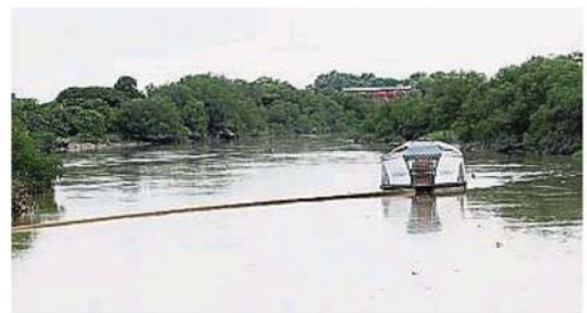
置放在巴生河中央的拦截垃圾浮台, 如今正进行为期半个月的维修工作, 因此该拦截垃圾的浮台并没有运作。