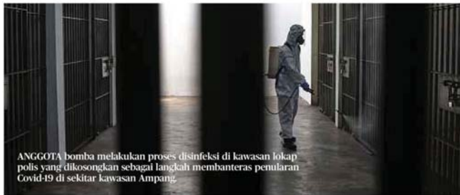
ANGGOTA bomba melakukan proses disinfeksi di kawasan lokap polis yang dikosongkan sebagai langkah membanteras penularan Covid-19 di sekitar kawasan Ampang.

Selain itu, katanya, Tentera Laut Diraja Malaysia (TLDM) dan Agensi Penguatkuasaan Maritim Malaysia (APMM) juga mengawasi kawasan perairan negara bagi mencegah pencerobohan bot nelayan asing melalui tindakan tegas termasuk menghalang serta mengusir mereka.